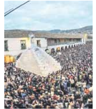
Personas gastarán S/514.