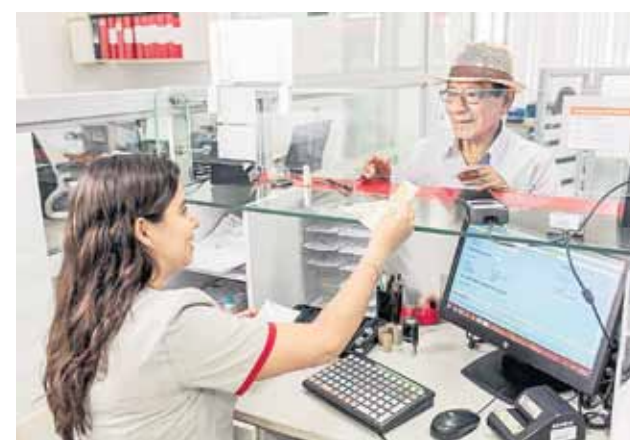
AUMENTO. Se fijarían pensiones en S/600 y S/1.000.